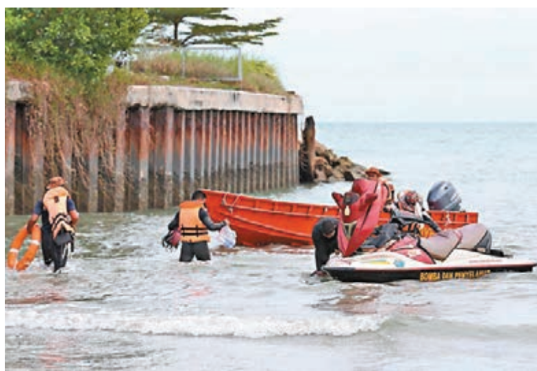
發生參賽者游泳失蹤後，拯救人員展開搜救行動。

馬來西亞國家青年體育部部長賽沙迪在意外後趕往現場了解情況，他向死者家屬致以慰問，指當局將成立特別調查小組調查今次意外，包括調查賽事是否涉及有人違規或違法。