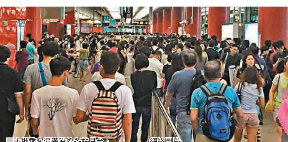
大批乘客逼滿沿線各站月台。

另一名男乘客石先生則指，本來往北角的月台，突然臨時改往康城，的確有些混亂。港鐵的混亂情況亦不止於對乘客的服務，連對傳媒發放的訊息亦一塌糊塗，事